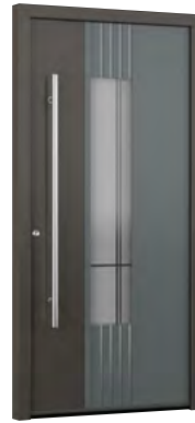
MIK CL 110