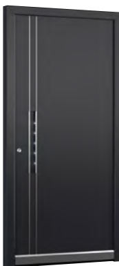
MIK IL 102