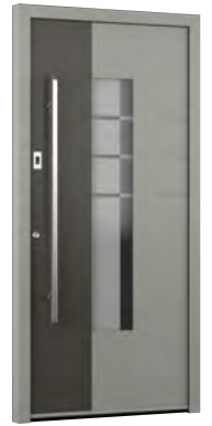
MIK CL 113