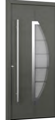
MIK AL 112