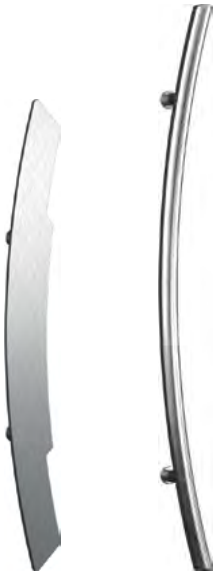
R83A 800 mm