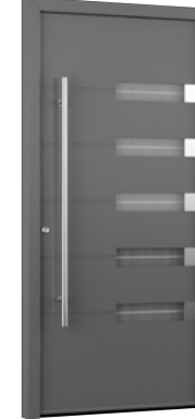
MIK AL 114