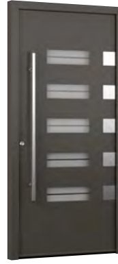
MIK AL 108