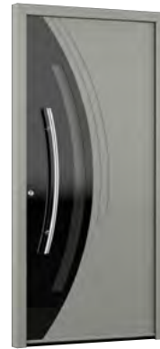
MIK TD 105