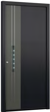
MIK CL 117