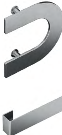
R84A 225 mm