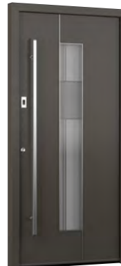
MIK IL 107