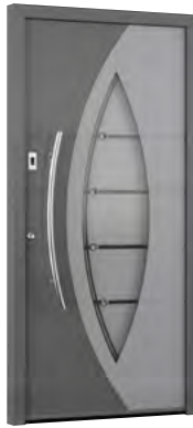
MIK CL 109