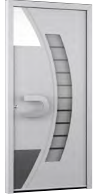
MIK AL 117