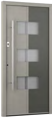
MIK CL 103