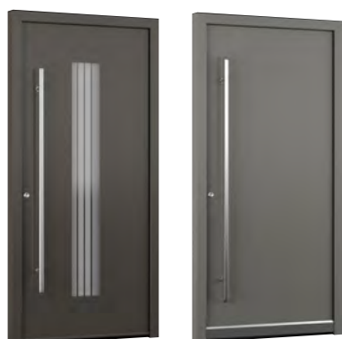
MIK AM 01