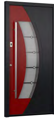
MIK CL 111