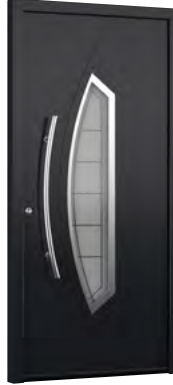
MIK AL 103