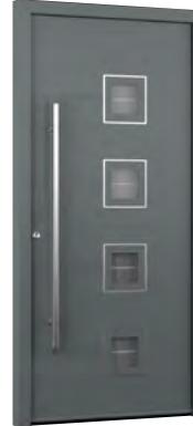
MIK AL 109