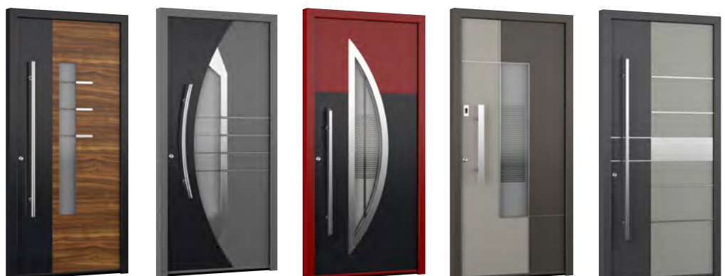
MIK CI 101