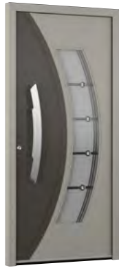
MIK CL 104