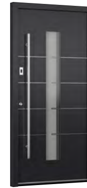
MIK IL 110