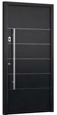
MIK IL 112