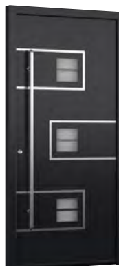
MIK IL 103