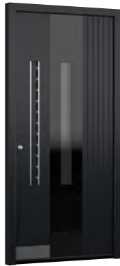
MIK TD 103