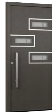
MIK IL 108