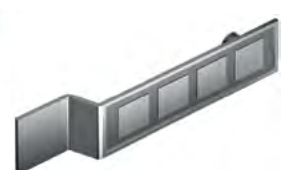
R86A 380 mm