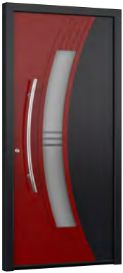
MIK CL 101