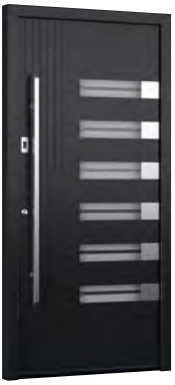
MIK AL 101