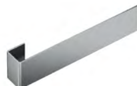
R85A 380 mm