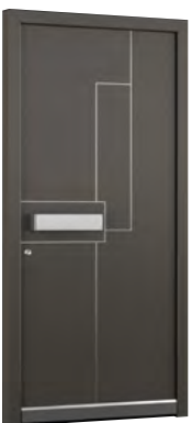
MIK IL 101