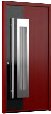
MIK TD 101