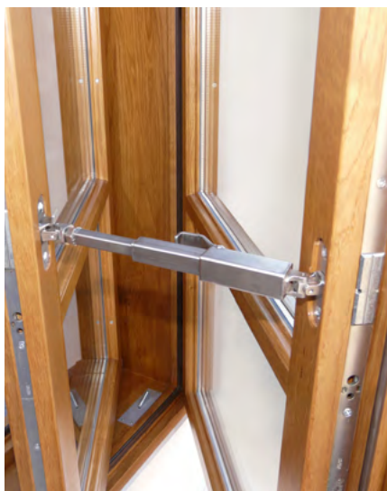
Inovativen sistem za odpiranje obeh kril škatlastega okna hkrati