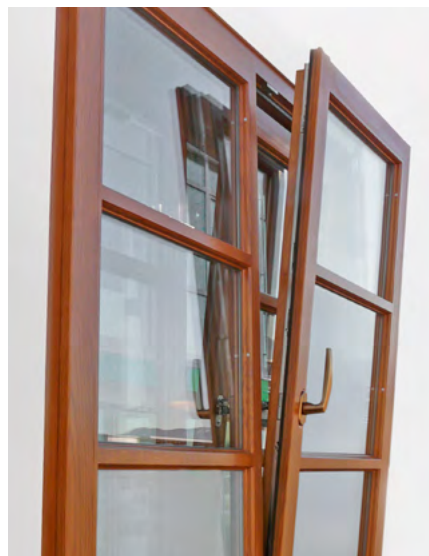
Notranja stran dvokrilnega škatlastega okna odprtega na kip