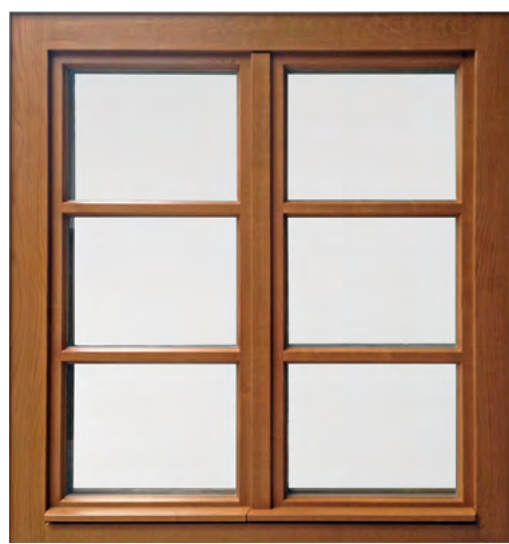
Dvokrilno škatlasto okno s sistemom odpiranja obeh kril hkrati