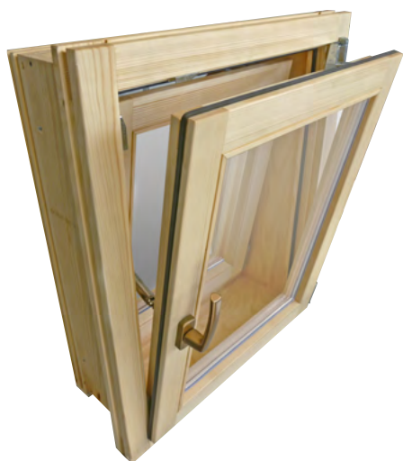
Odpiranje enokrilnega škatlastega okna na kip