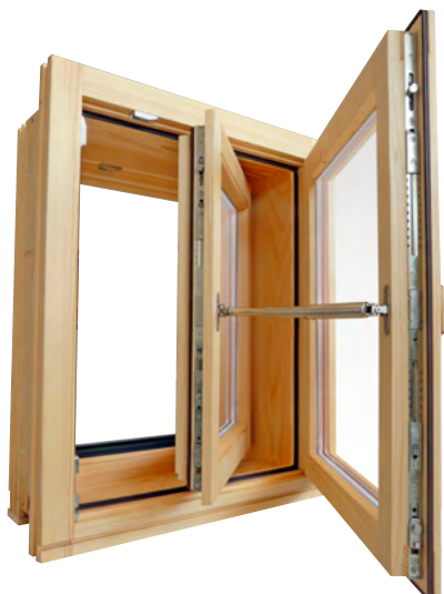
Enokrilno škatlasto okno s sistemom za odpiranje obeh kril hkrati

lični kombinaciji materialov (les-alu, les-pvc, les-les). Inovativen sistem odpiranja, sodobno okovje in standardni visoko toplotno in zvočno izolativni profili z večslojno zasteklitvijo, zagotavljajo odlično rešitev zasteklitve vseh objektov, kjer želimo ohraniti arhitekturno dediščino in si hkrati zagotoviti sodoben, topel in zvočno izoliran dom.