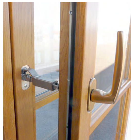
Inovativen sistem za odpiranje obeh kril škatlastega okna hkrati